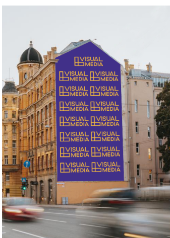
vizualizācija uz ēkas